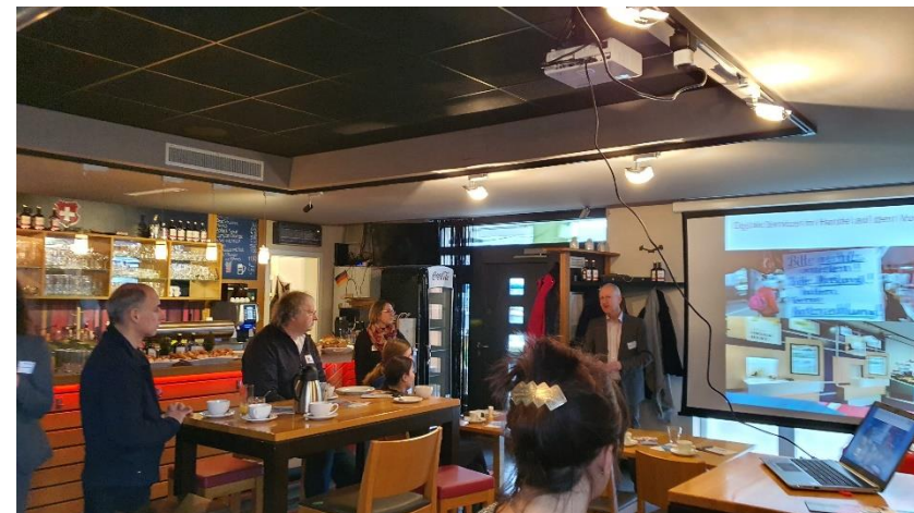
Unternehmerfrühstück am 03.03.2023 im Gleis 2