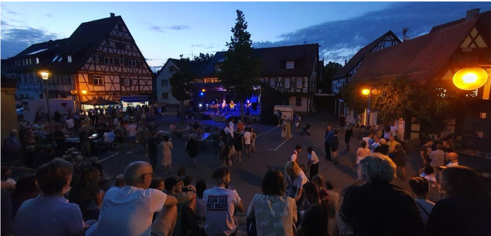
Renninger Einkaufsbummel Juli 2023