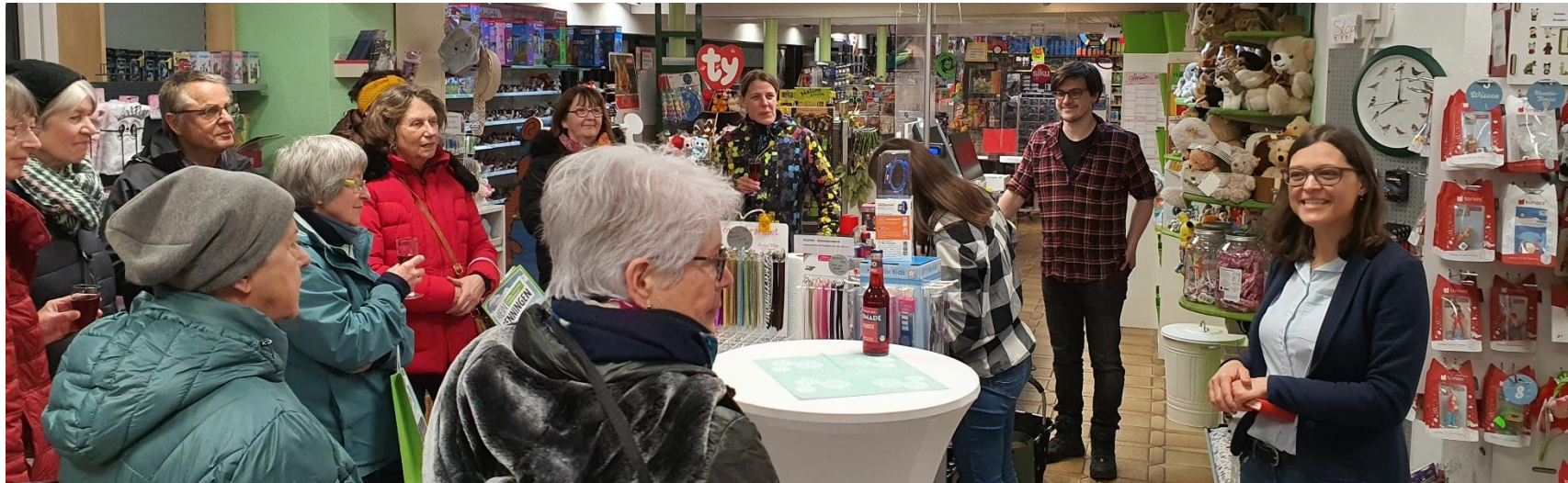
Die 5. Renninger Abendtour führte die Teilnehmerinnen unter anderem zu Spielwaren Kauffmann

Bei einer unterhaltsamen und informativen Abendtour durchs Stadtgebiet präsentieren sich vier örtliche Unternehmen und Unternehmer und ermöglichen den Teilnehmern einen unverbindlichen „Blick hinter die Kulissen“. Jeder der vier Geschäftsinhaber wird nicht nur sich und seine Angebote bzw. Dienstleistungen vorstellen, sondern auch aus dem Berufsleben erzählen. In Kleingruppen erfahren Sie mancherlei Originelles und Wissenswertes und lernen Geschäfte kennen, die Sie möglicherweise so noch nicht wahrgenommen haben. Der Inhaber hat Zeit für Sie und Sie lernen ihn einfach ganz persönlich kennen. Sicherlich auch ein gutes Angebot für unsere Neubürger/innen um Kontakte zu knüpfen und die Gegebenheiten vor Ort kennen zu lernen.