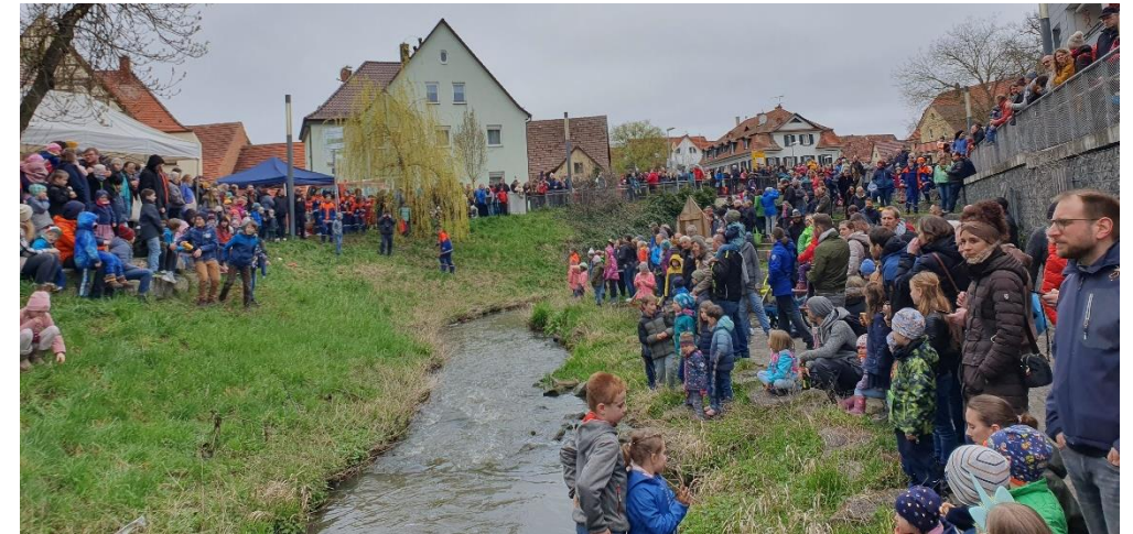
Ostermarkt Malsheim April 2023