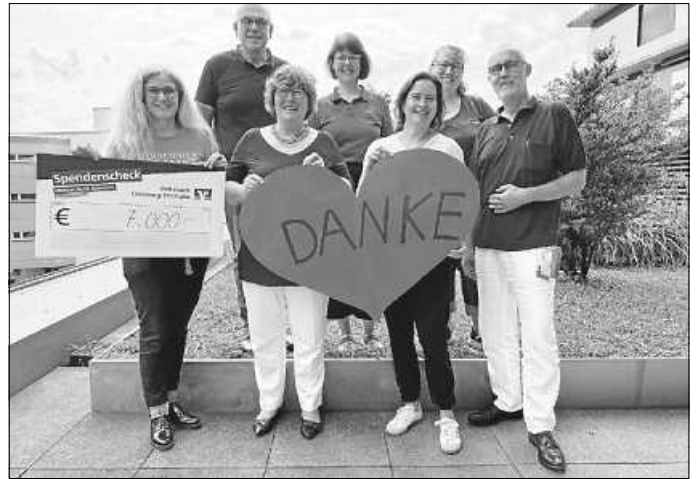
Scheck 7.000,- EUR

und wir können eine App mit einer Spende von 7.000,- Euro