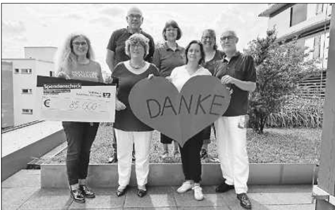
Scheck 85.000,- EUR

... wirklich unfassbar – wir konnten die Psychologenstelle mit 85.000,- Euro wieder für mehr als 1 Jahr absichern