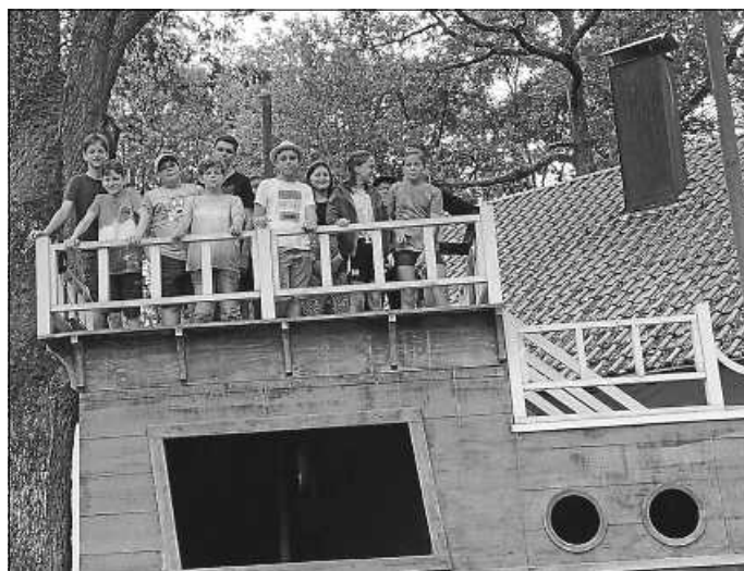
Begehung des Kulissenschiffs, die Besuchern normalerweise nicht gestattet ist.

Am 21. Juli nahmen 13 Kinder zwischen 11 und 14 Jahren im Rahmen des Sommerferienprogramms der Stadt Renningen an einem ganz besonderen Tag im Naturtheater teil. Zum einen durften sie in einem Improvisationstheater-Kurs selbst ein wenig Theaterluft schnuppern, zum anderen erlebten sie die Stunden vor der Aufführung von „Peter Pan“ hautnah mit, indem sie bei der Tanzprobe des Ensembles dabei sein durften und eine Führung hinter die Kulissen bekamen. Den Abschluss bildete dann natürlich das gemeinsame Anschauen der Aufführung. Wir danken allen Teilnehmern für ihr Interesse und allen Helfern des Naturtheaters für die Organisation.