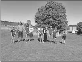
Die Teilnehmer des Sommerferienprogramms