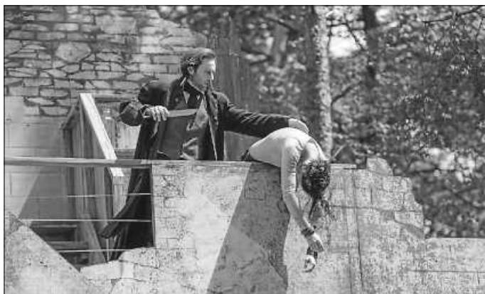
Victor Frankenstein erschafft sein Monster.

Außerdem gibt es wieder eine Mitmachaktion, bei der durch geschicktes Schätzen tolle Preise gewonnen werden können.