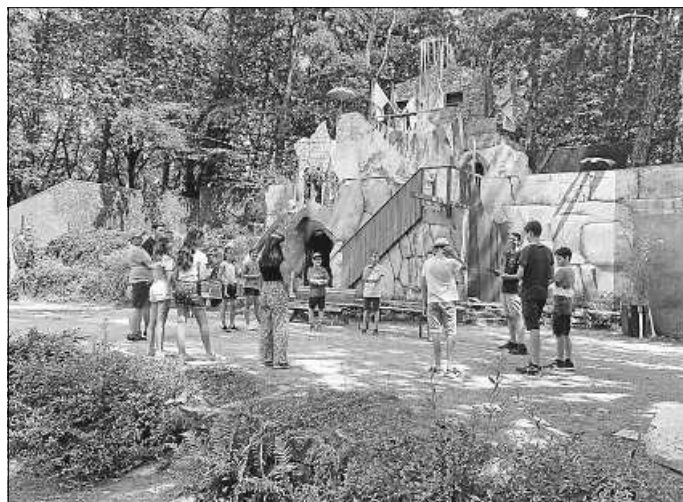
Improvisationstheater-Kurs auf der Naturtheater-Bühne